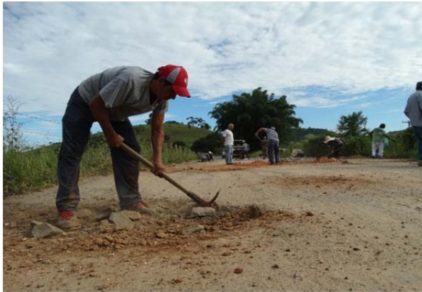
Diamante recebe operação tapa-buraco