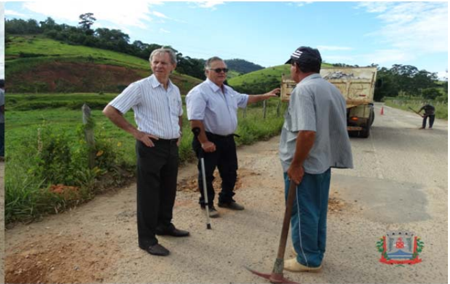
Prefeito esteve na estrada de Diamante acompanhando os serviços

Condutores que trafegam pela Avenida Santa Maria, na saída do Distrito de Diamante em direção a Astolfo Dutra, terão melhores condições de percurso nos próximos dias. A Secretaria Municipal de Obras realiza, desde a última segunda-feira (23) Operação Tapa-Buraco e Calçamento ao longo da via.